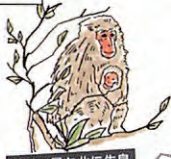
世界で最も北に生息 北限のサル